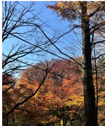
写真は、六甲の館の近くで撮りました！

先月、六甲山の紅葉が綺麗で、毎日、大渋滞がありました。TVでも紹介されたので、神戸市森林植物園に行かれたようです。